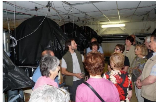
Dans la halle « Grossissement des poissons »

La dernière partie de la visite a concerné un laboratoire à ciel ouvert qui expérimente une technique novatrice de production de micro-algues, extrêmement prometteuse en ce sens qu'elle permet de recycler l'eau, d'équilibrer les gaz (CO 2 et O 2 ) et de récolter les algues, avec une efficacité accrue et une consommation énergétique réduite.