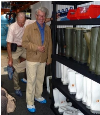
Entrée dans la halle « Systèmes d'élevage » : chaussons bleus obligatoires !

Nous avons visité les 4 premières halles.