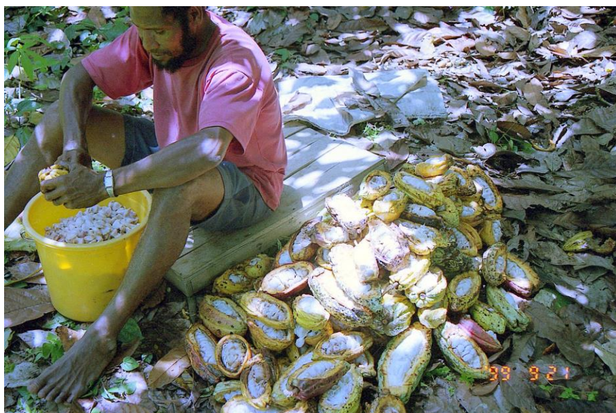
IV PNG 1.2 - Oro Province 06 : Ecabossage manuel, en tous points méthodiques ; opérateur confortablement installé, maturité des fruits parfaite, toutes les cabosses préalablement ouvertes, longitudinalement, prêtes à être égrainées (1999).