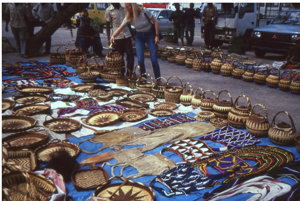
IV PNG 1.1 - Central Province 14 : Port-Moresby (1997). Etalage de vanneries provenant pour la plupart du centre du pays, les Highlands autour de Goroka.