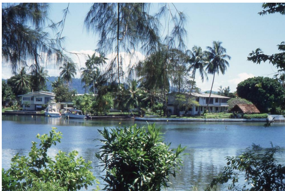
IV PNG 1.2 - Madang Province 10 : Cases de privilégiés en bordure de lagune (1995).