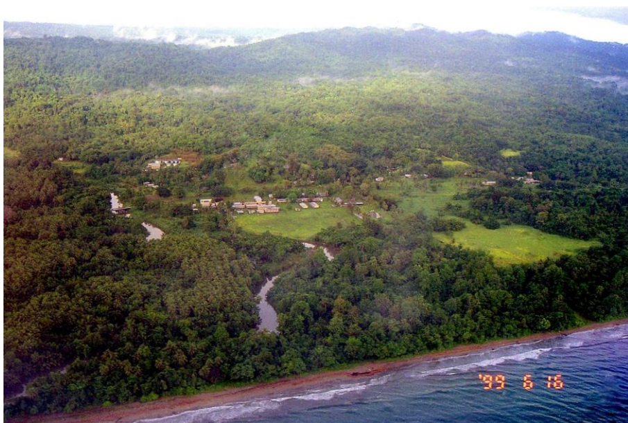
IV PNG 1.2 – East Sepik Province 02 : Ce littoral, à l'approche de Wewak, n'est pas à l'abri des tsunamis pouvant survenir à la suite de séismes ou d'éruptions volcaniques en mer : cela s'est produit en 1998, plus au nord- ouest, à Aitape sur la côte de la province voisine, Sandaun Province (1999).