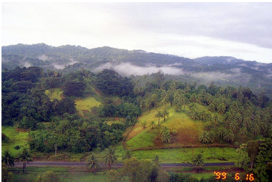
IV PNG 1.2 – East Sepik Province 03 : Nappes de brouillard, d'une vallée à l'autre, générant les « montagnes à nuages » (1999).