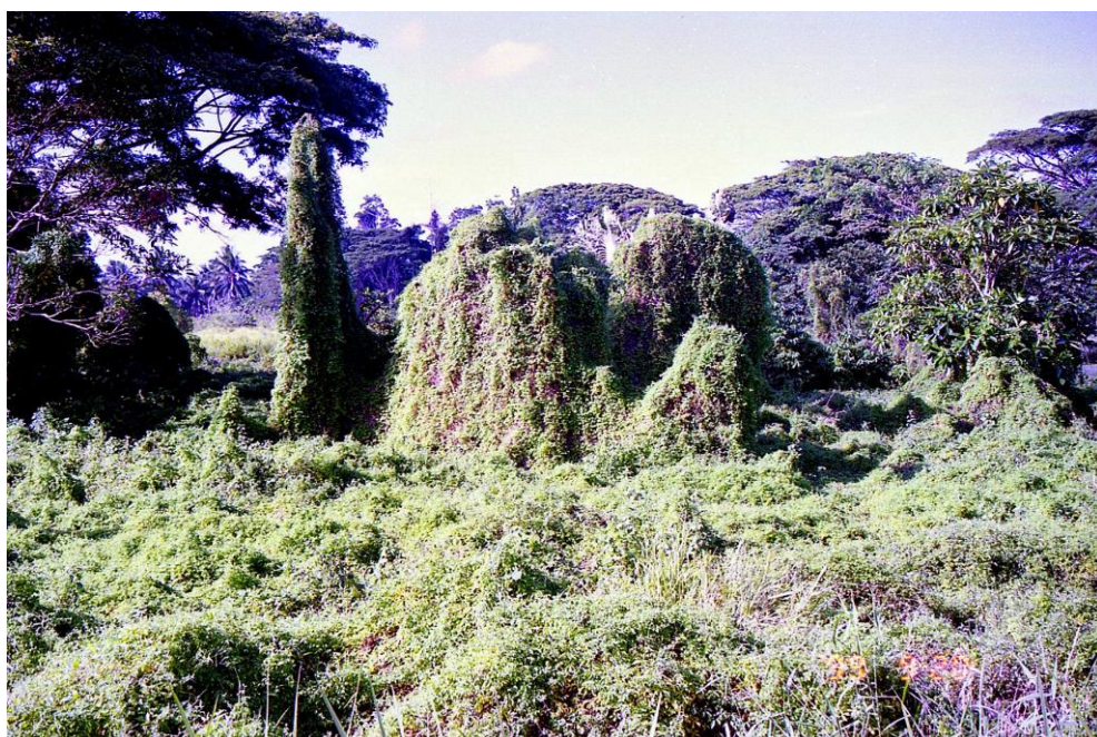
IV PNG 1.2 - Oro Province 07 : Aspect de l'envahissement d'une cacaoyère par Mikania : une mauvaise herbe qui aurait été malencontreusement introduite en PNG lors de la Deuxième Guerre mondiale (1999).