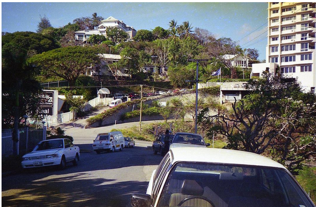
IV PNG 1.1 - Central Province 12 : Villas et sièges d'entreprises sur les collines autour de Port Moresby, ville éclatée régissant plusieurs agglomérations (1997).