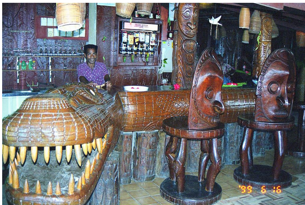
IV PNG 1.2 – East Sepik Province 06 : Rien d'étonnant de retrouver ce crocodile de taille imposante et peu engageante en guise de comptoir dans une salle de restaurant (en PNG, les crocodiles les plus imposants se trouvent en eaux saumâtres) (1999). Mais la profusion des sculptures atteste bien l'attrait artistique envahissant qui caractérise la province East Sepik et en fait sa réputation.