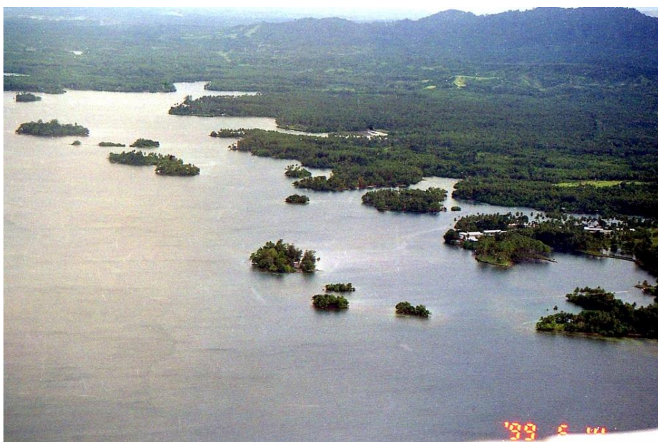
IV PNG 1.2 - Madang Province 13 : Nombreuses mangroves à l'arrivée sur Madang (1999).