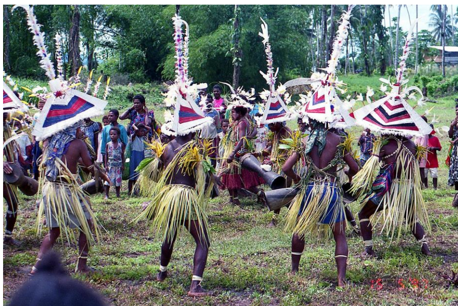
IV PNG 1.2 - Madang Province 03 : Singsing à l'occasion de ce même Opening Day (1997).

Ici, une ethnie remarquable par la conception de ses jupes en fibres végétales et de ses couvre-chefs de grandes tailles, vivement coloriés et dont les sommets sont ornés d'une hampe fleurie (transmission imagée sur la perception des mâts et voiles des premiers bateaux européens aperçus). Ainsi costumés et aussi énergiques dans leur prestation, les différents groupes du singsing instauré sous l'administration australienne perpétuent le sens de la compétition pacifique entre ethnies ou entre clans dans la même ethnie à la place de toute confrontation belliqueuse et meurtrière.