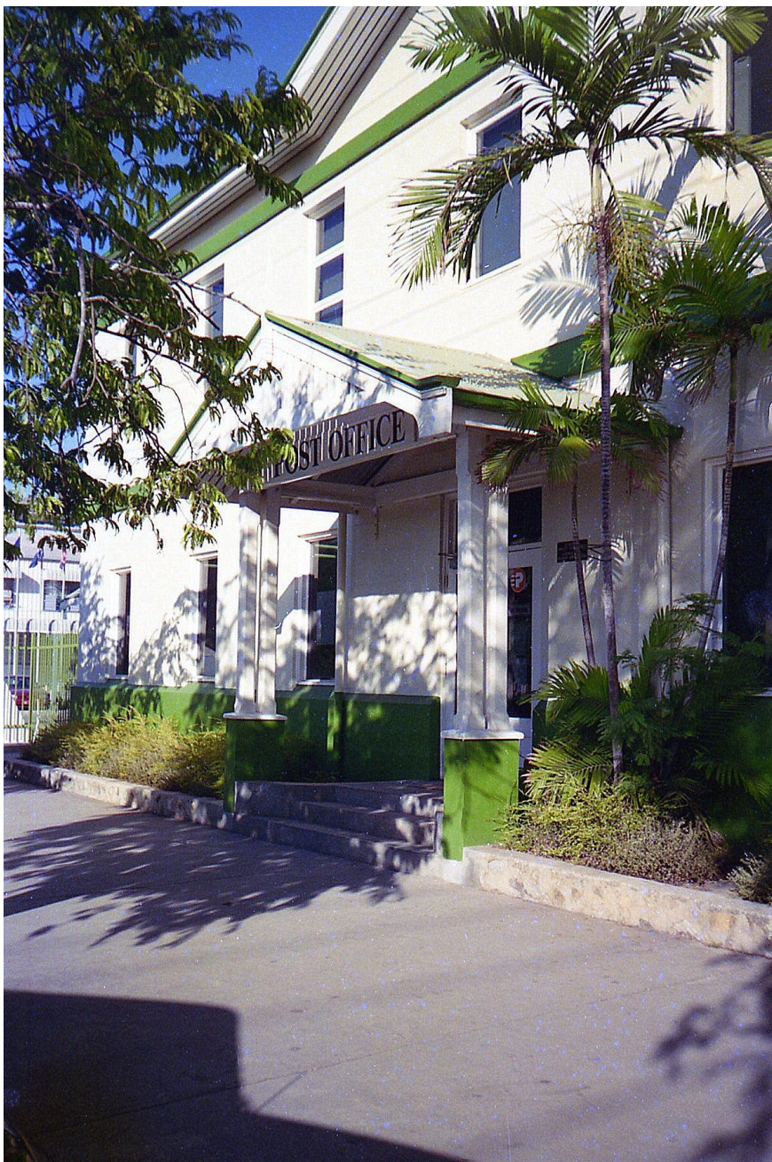
IV PNG 1.1 - Central Province 10 : Port Moresby (1997). Le bureau de poste à la croisée de Champion Parade Street avec Cuthbertson Street.