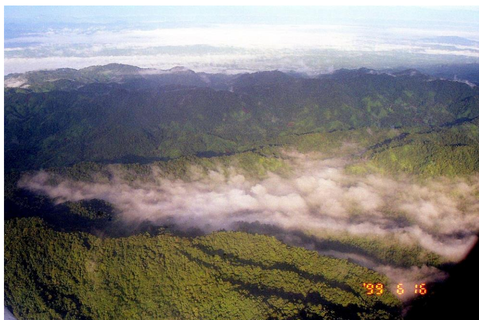
IV PNG 1.2 – East Sepik Province 12 : Retour sur Madang après avoir quitté Wewak. Survol de nombreuses petites collines couvertes de forêts luxuriantes ou forêts pluviales en raison d'une forte humidité toujours partout présente, les biens nommées rainforests (1999).