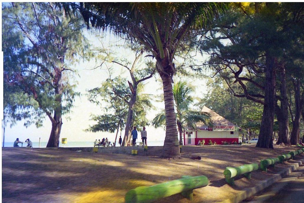
IV PNG 1.1 - Central Province 13 : Port Moresby (1997). Sur Ela Beach Road reliant les agglomérations du bord de mer (1997).