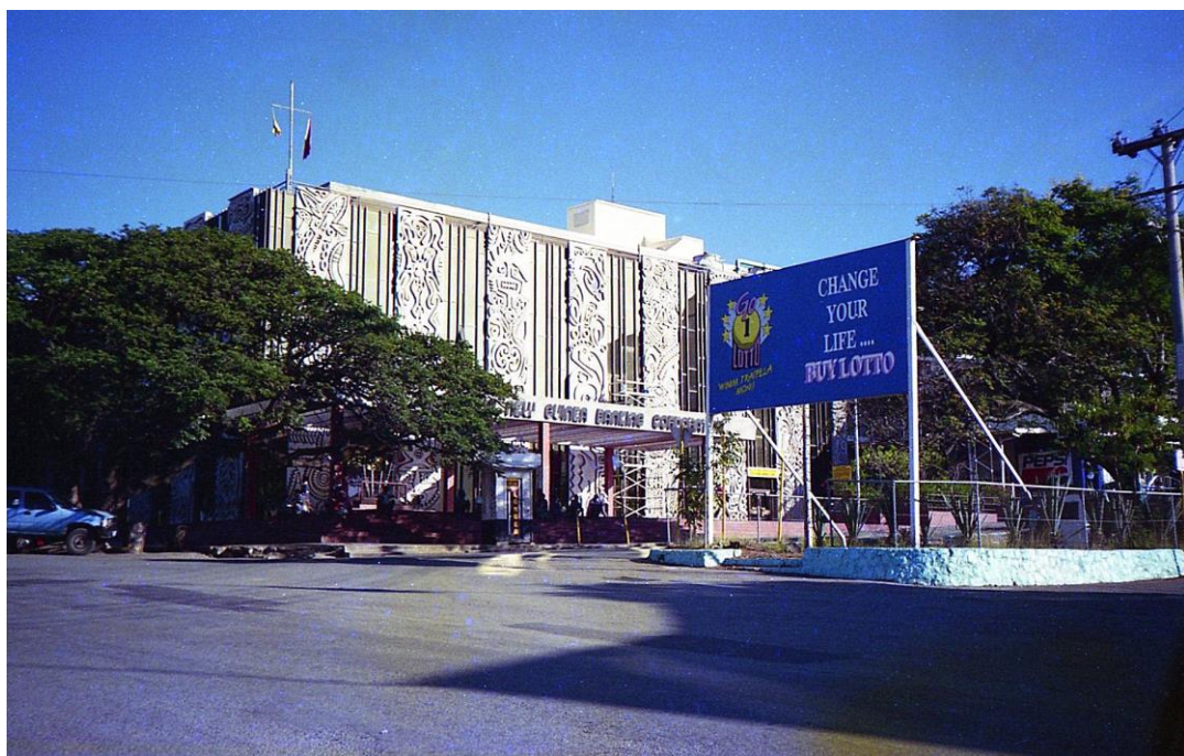
IV PNG 1.1 - Central Province 11 : Port-Moresby (1997). Coïncidence, apparemment pas étrangère, à la présence de ce panneau publicitaire du Loto devant une des banques de PNG, la New Guinea Bank Corporation.