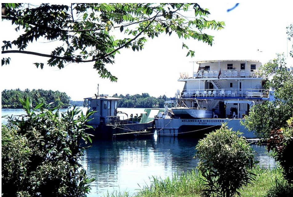
IV PNG 1.2 - Madang Province 11 : Le Melanesian Discoverer à son port d'attache à Madang. Il est utilisé pour des croisières sur le Sepik, une rivière importante dans sa partie en aval et située dans la province voisine, East Sepik Province (1995).