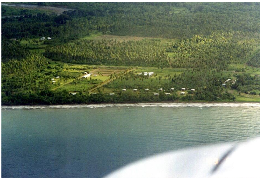
IV PNG 1.2 – East Sepik Province 01 : Littoral au nord de Madang à l'approche de Wewak, capitale et chef-lieu de la province East Sepik (1999).