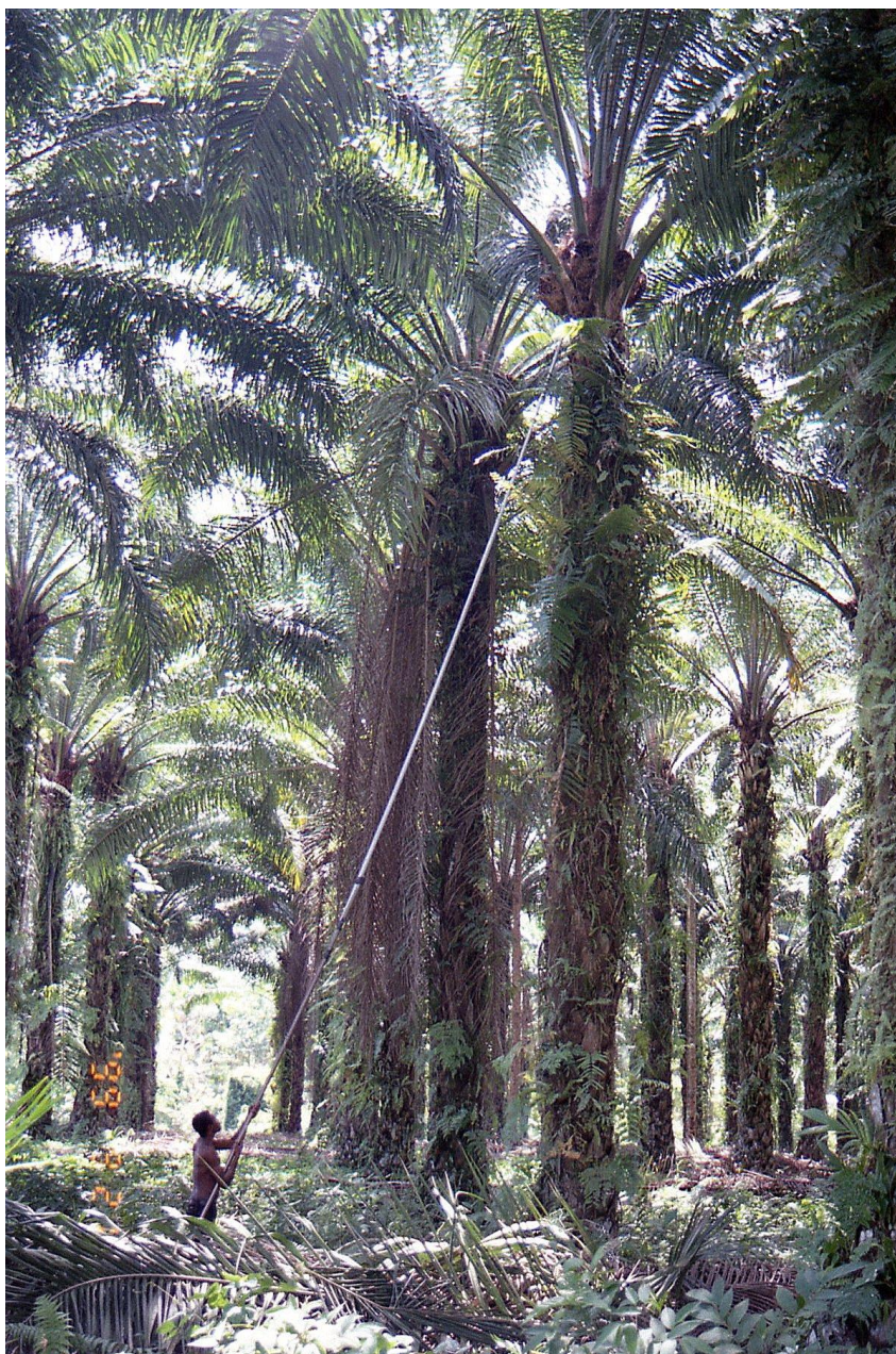
IV PNG 1.2 - Oro Province 11 : Autre exemple de développement excessif, concernant ici des palmiers à huile dans une plantation de toute évidence ancienne : la longueur de la perche manipulée par le récolteur est spectaculaire (1999). Cette province de l'Oro régie, en PNG, une industrie exclusivement basée sur les produits issus des régimes du palmier à huile.