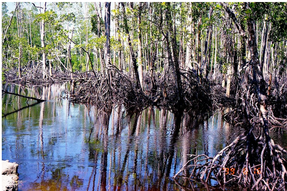
IV PNG 1.2 – East Sepik Province 10 : Type de mangrove en eau saumâtre (1999).