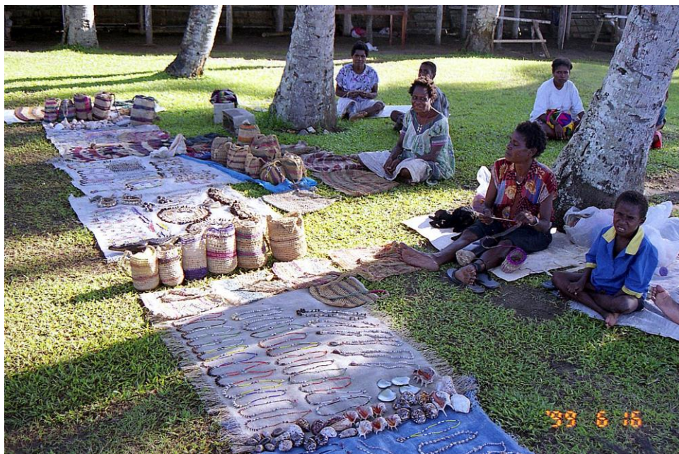
IV PNG 1.2 – East Sepik Province 04 : Dès le premier contact avec la province, l'abondance des objets exposés par ces vendeuses de souvenirs atteste le niveau artistique important de ses habitants (1999).

IV PNG 1.2 – East Sepik Province 05 : S'ajoutent, aux objets de taille raisonnable et habituelle pour touristes, des spécimens peu ordinaires et impressionnants comme cette tête de crocodile, le pukpuk (1999).