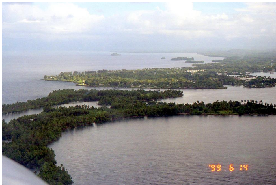
IV PNG 1.2 - Madang Province 12 : Aspect du littoral à l'approche de Madang (1999).