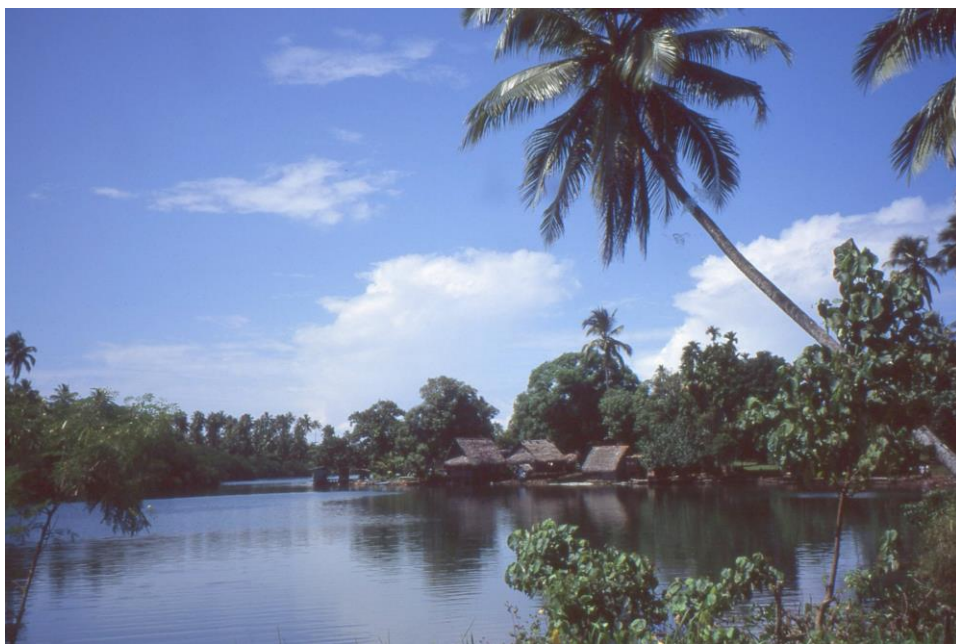
IV PNG 1.2- Madang Province 09 : Village lacustre proche de Madang (1995).