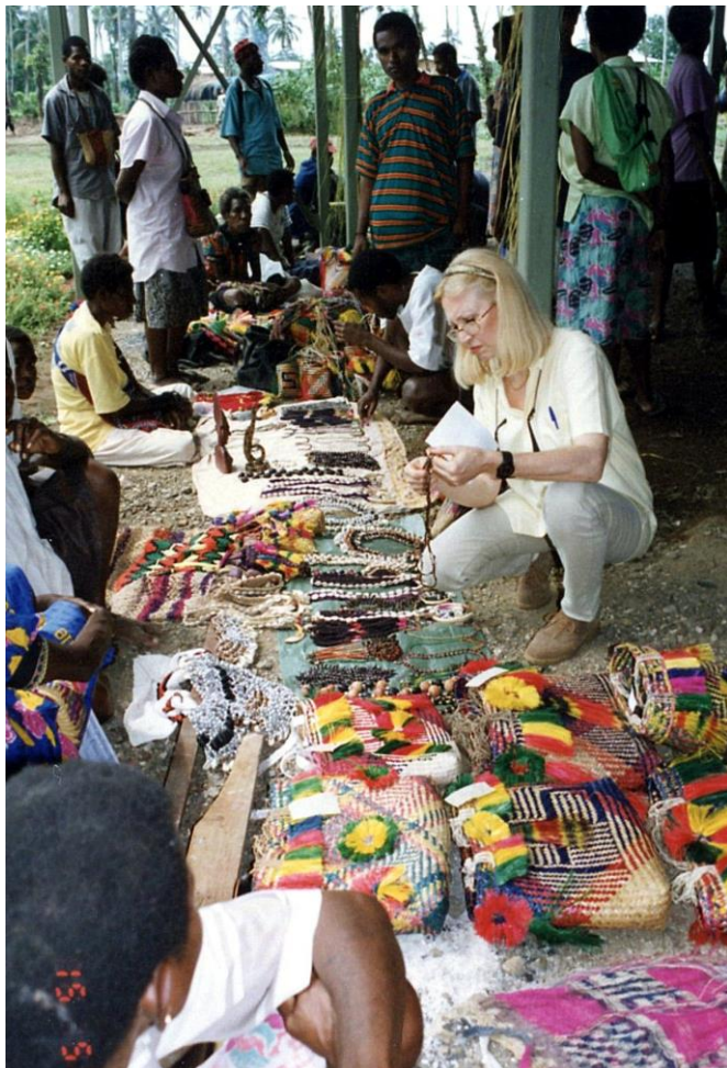
IV PNG 1.2 - Madang Province 01 : La Steward Research Station du CCRI (SRS) à Murnas près de Madang lors de son Opening Day du 9 avril 1997 : une belle occasion pour les vendeurs de souvenirs d'exposer tous leurs articles.