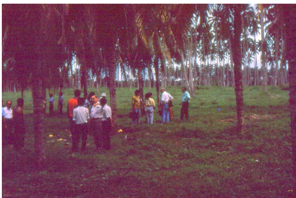
III Indo2 : Sulawesi. 09 : Colloque de Manado (1992). Concertation des participants sur le terrain.