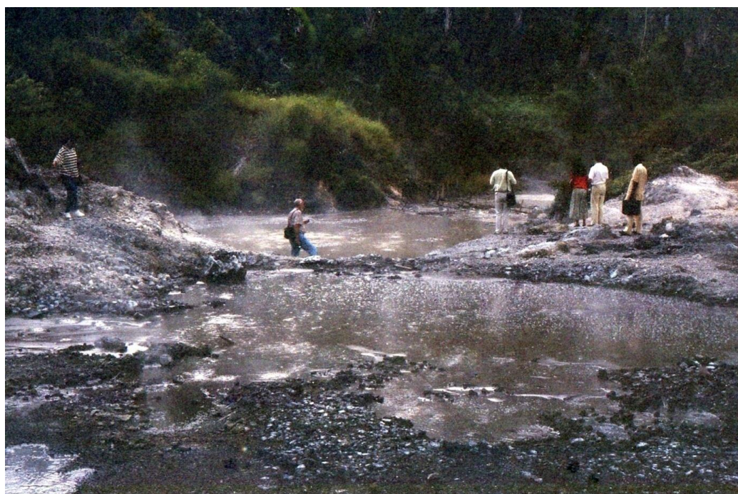
III Indo2 : Sulawesi. 22 : Caldeiras de Tandano (1992). Les plus téméraires des visiteurs s'aventurent encore un peu plus au milieu des fumerolles sulfureuses.