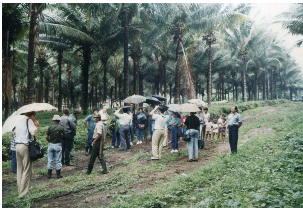
III Indo2 : Sulawesi. 15 : Colloque de Manado (1992). Visite sous la pluie d'une plantation industrielle de cocotiers.