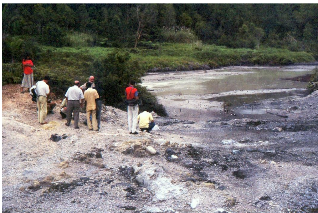
III Indo2 : Sulawesi. 21 : Caldeiras de Tandano (1992). Moment marquant de leur visite : des participants du colloque contemplant les boues volcaniques ponctuées de solfatares (dépressions de forme circulaire où les gaz sulfureux sont émis par de grosses bulles formées à la surface de la boue volcanique).