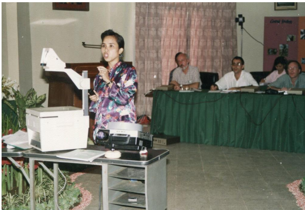
III Indo2 : Sulawesi. 07 : Colloque de Manado (1992). Présentation d'une participante indonésienne convaincue et convaincante si on en croit l'attention portée par les participants.