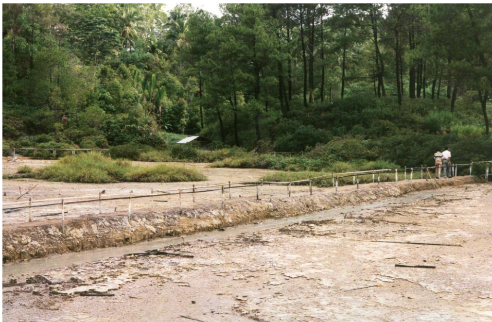
III Indo2 : Sulawesi. 20 : Caldeiras de Tandano (1992). Début de la visite par un lac de boues volcaniques.