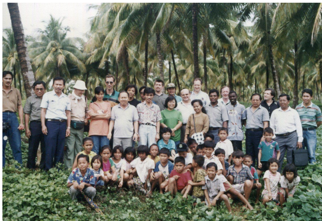
III Indo2 : Sulawesi. 13 : Colloque de Manado (1992). Photo de groupe pour marquer la fin du colloque, la jeune génération, en remerciements, s'invitant au tout premier plan.