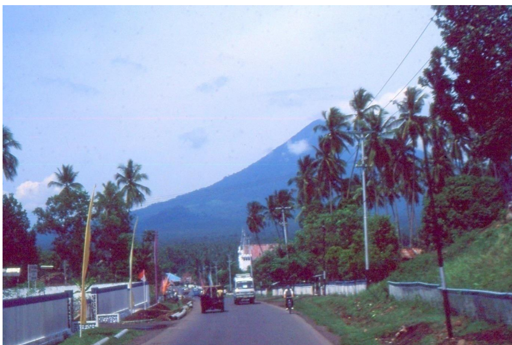
III Indo-Sulawesi. 16 : Sur la route menant à Tomohon (1992). Oriflammes en bordure de route avec, en arrière-plan, la silhouette plutôt inquiétante du volcan Empung-Lokon (1340 m).