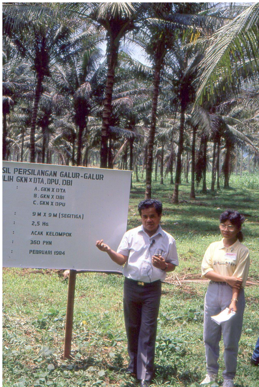
III Indo2 : Sulawesi. 12 : Colloque de Manado (1992). Présentation des différentes combinaisons hybrides suivies pour leur réaction à la maladie en conditions naturelles.