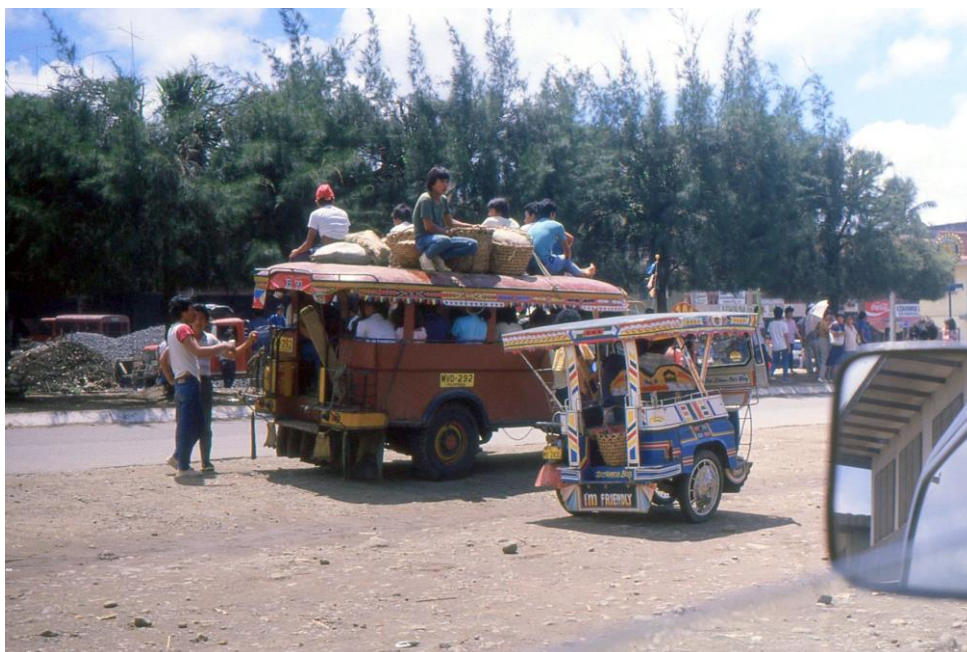
III Phil5 : Sud-Mindanao. 03 : Davao, la gare routière (1987). Les voyageurs nombreux s'installent aussi bien à l'intérieur qu'à l'extérieur, sur le toit de la jeepney . A remarquer, le tricycle bien chargé lui aussi.