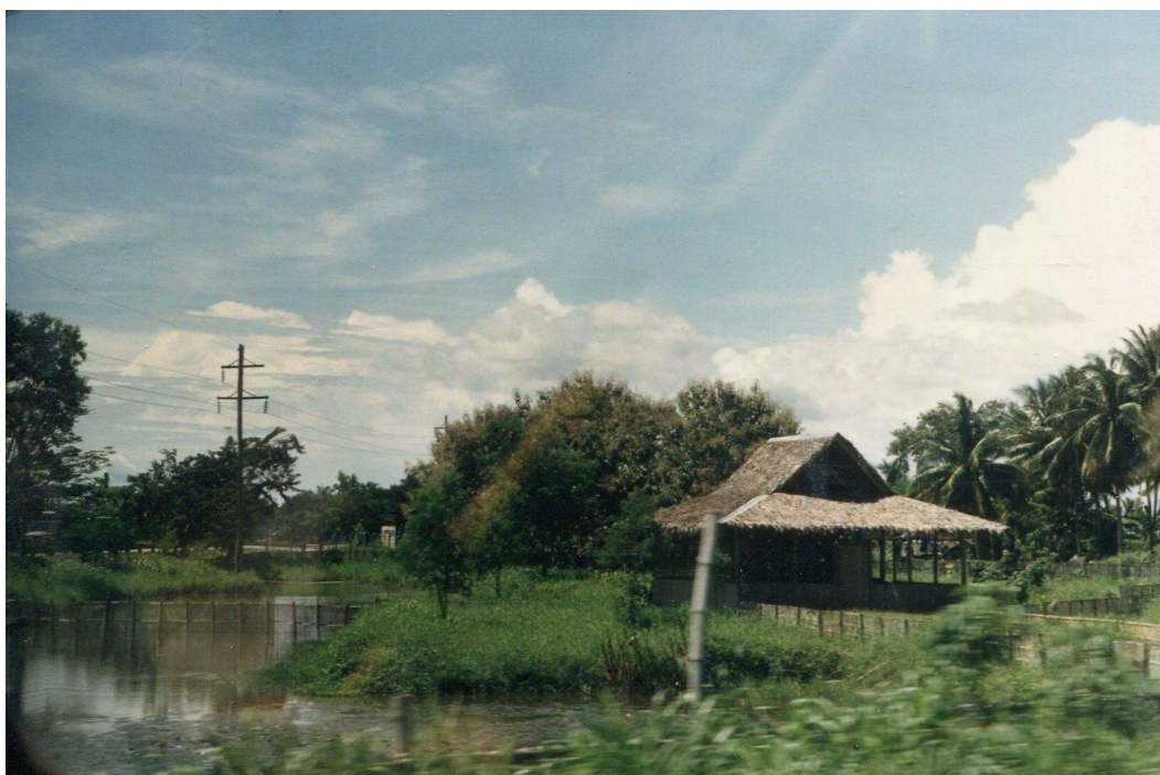
III Phil5 : Sud-Mindanao. 05 : En quittant Davao vers Tagum à l'est, paysage d'une campagne riche en cours d'eau, souvent inondée (1987).