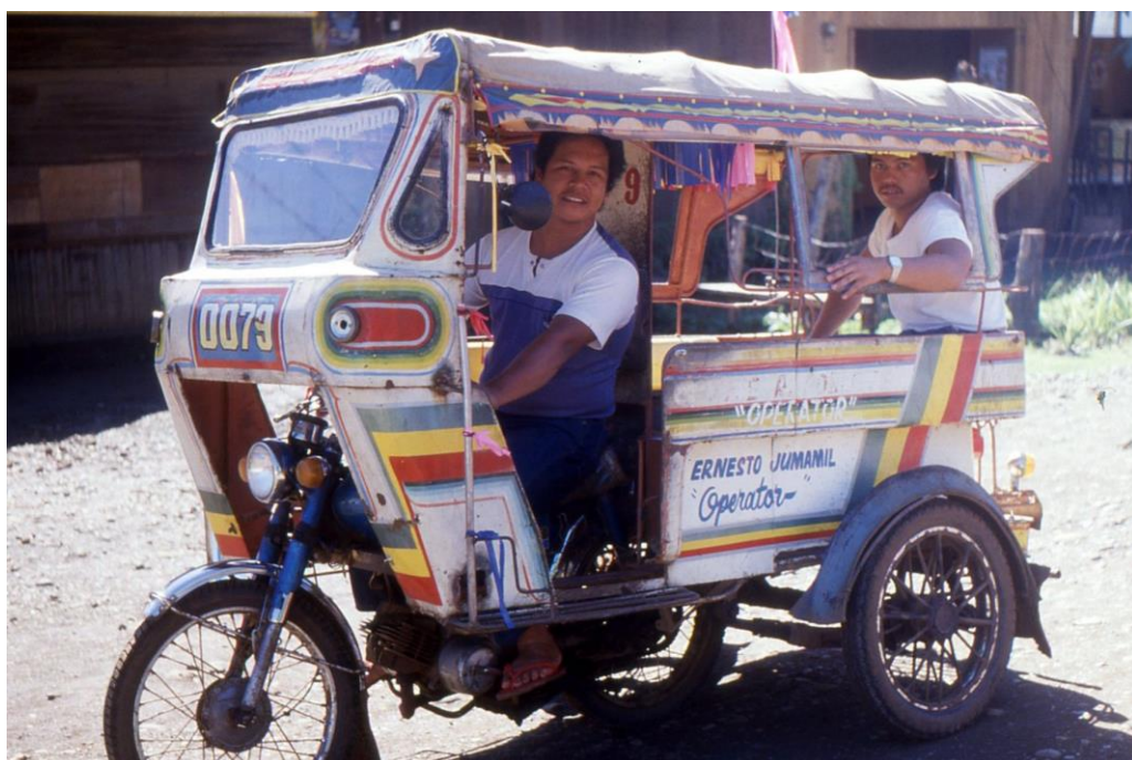
III Phil5 : Sud-Mindanao. 04 : Davao, la gare routière (1987). Le motor-bike de Los Baños a laissé ici la place à un tricycle avec plus de confort autant côté passagers que côté conducteur. L'élégance n'est pas non plus en reste (attirance commerciale aussi bien du matériel que des slogans).