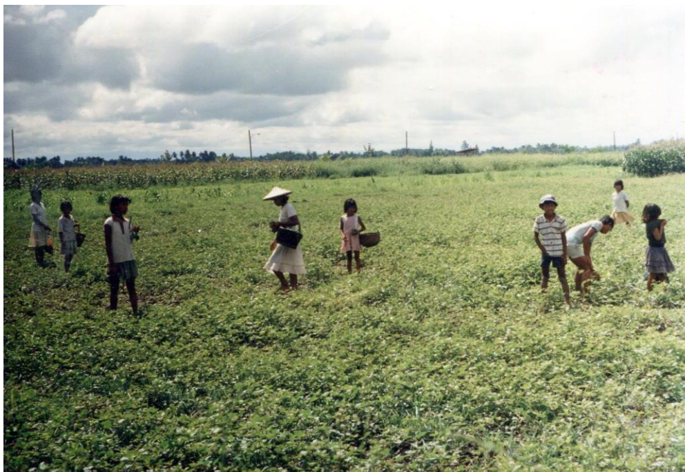
III Phil5 : Sud-Mindanao. 11 : Retour vers Davao par la DC rd (Davao-Cotabato road) (1987). Prédominance d'enfants parmi les participants aux récoltes.