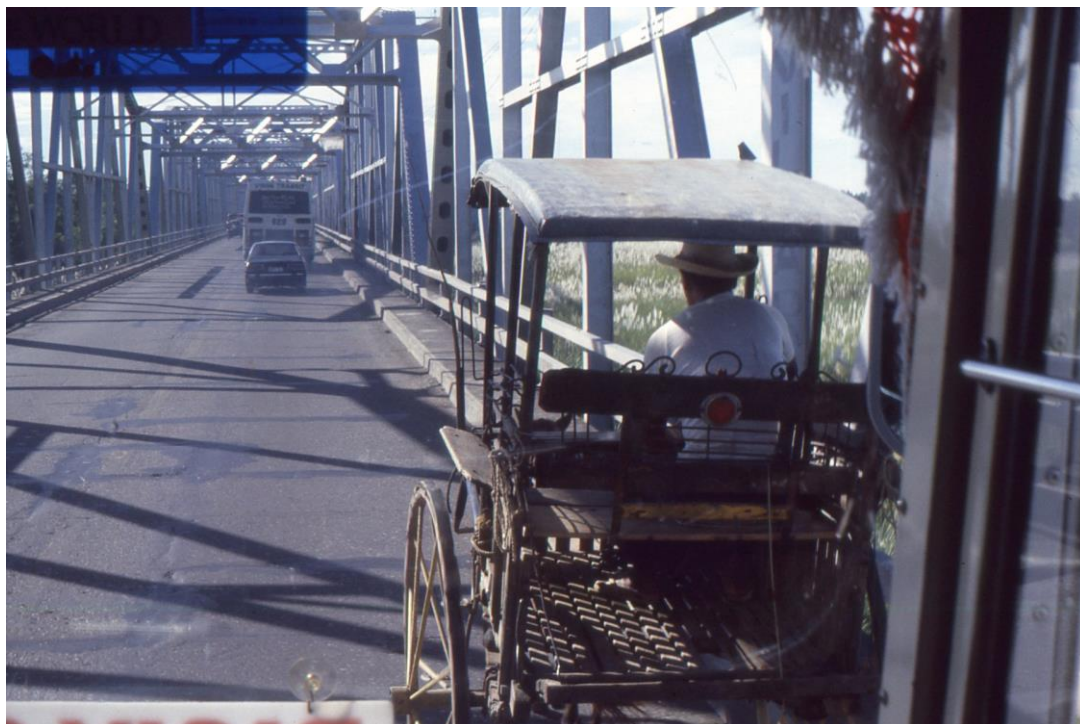
III Phil4 : Nord-Mindanao. 16 : Cagayan de Oro, province du Mirasmis Oriental, traversée de la Cagayan de Oro River sur le Governor Ysahña Bridge (1987). Le rang social s'affiche avec le moyen de transport utilisé : la charrette ou la carriole, avec l'âne ou le mulet, le motor-bike ou la voiture...