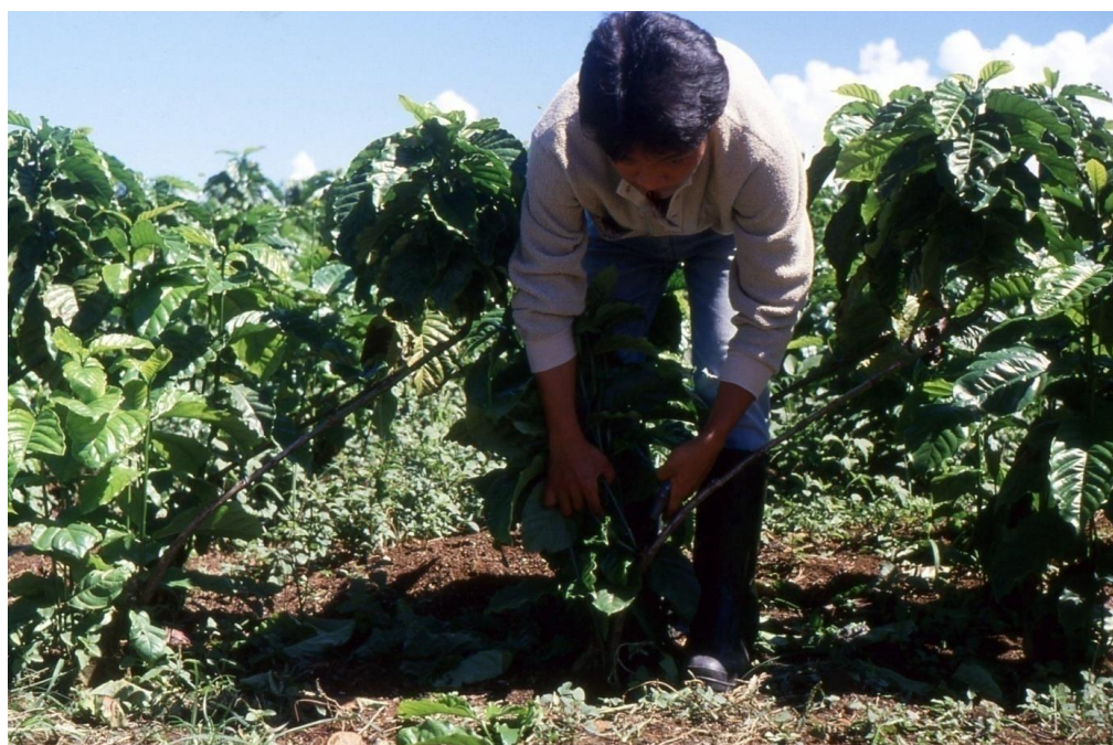
III Phil4 : Nord-Mindanao. 10 : Valencia (1987). Entretien dans une parcelle de jeunes caféiers Robusta.