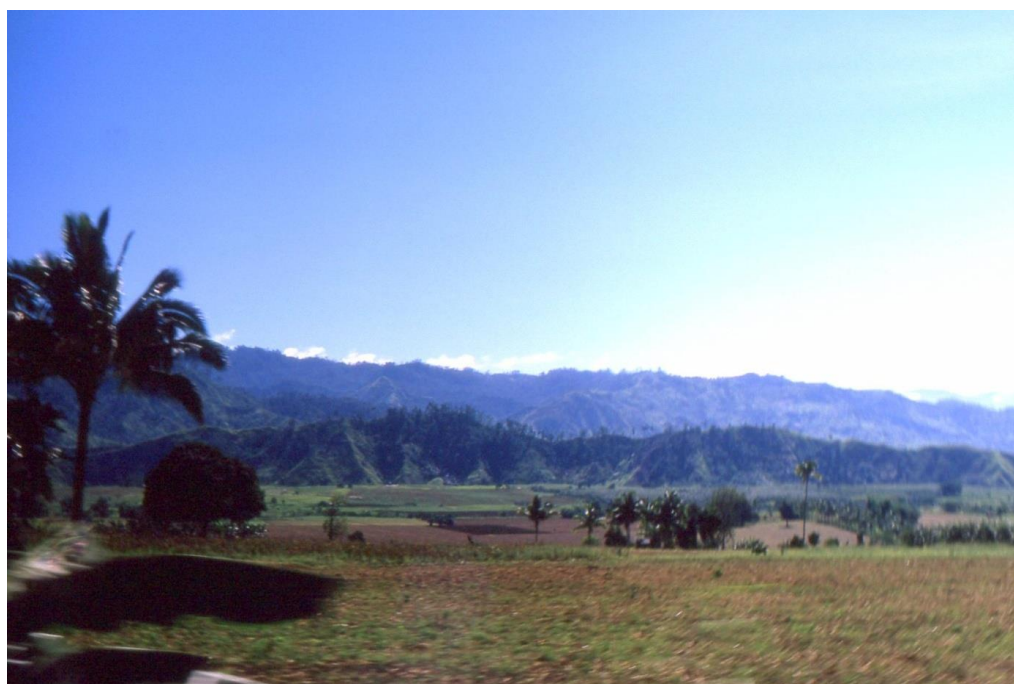
III Phil4 : Nord-Mindanao. 05 : Paysage de la plaine Sumilao en suivant, vers le sud, la Sayre HighWay (1987). Début de la chaîne montagneuse des monts Kitanglad et Katanglad (contreforts plissés typiques).