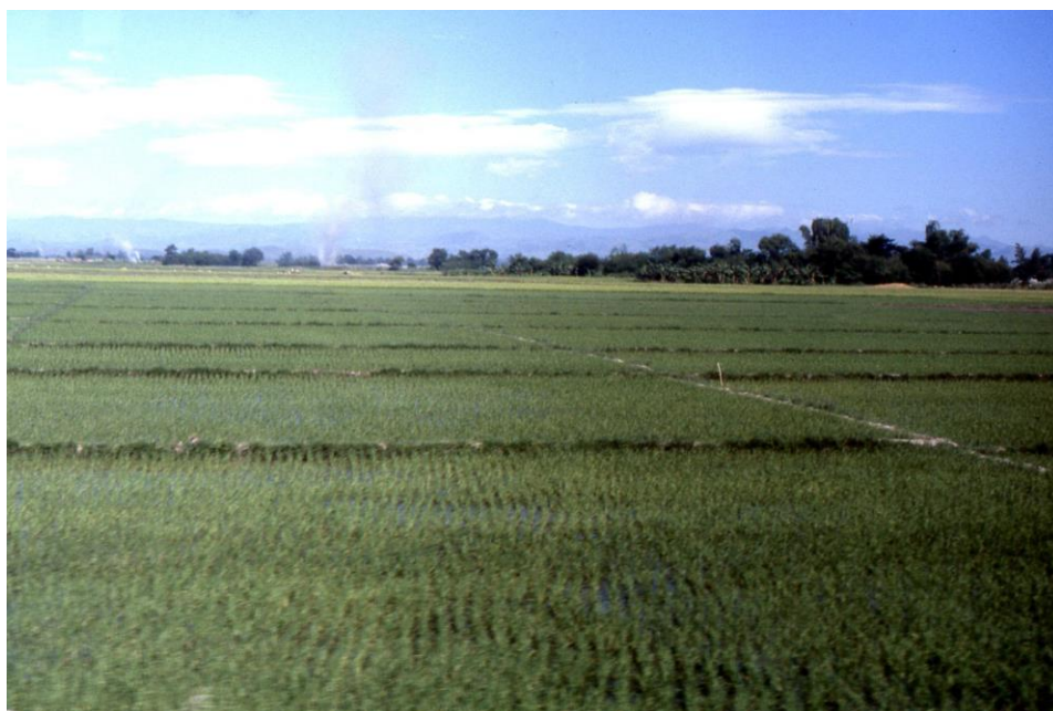
III Phil4 : Nord-Mindanao. 04 : Vers le sud, sur la Sayre HighWay entre Cagayan de Oro et Sumilao (1987). Rizières en cours de production.