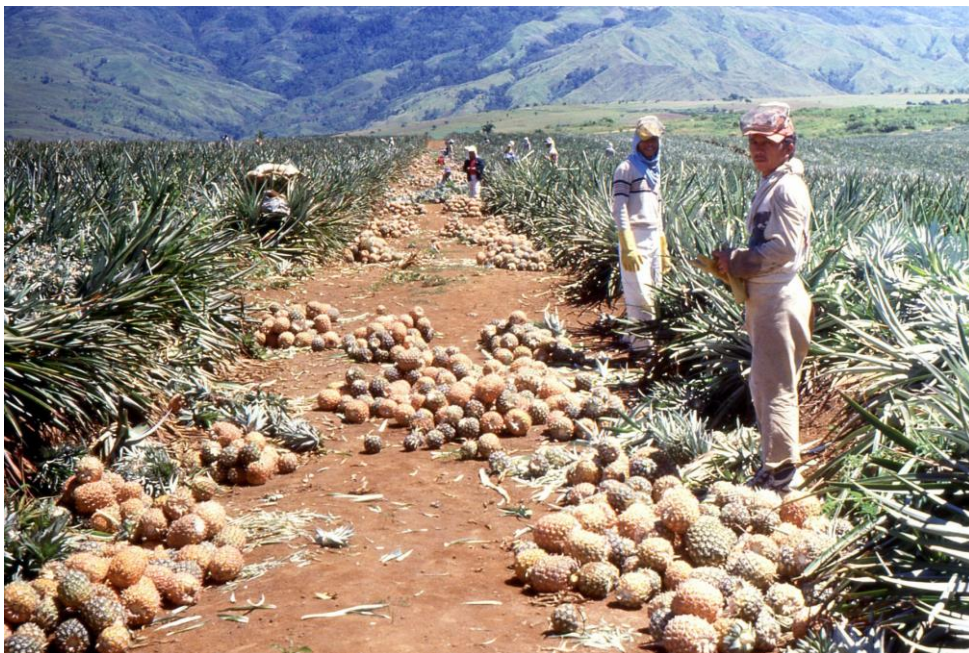
III Phi4 : Nord-Mindanao. 13 : Province du Bukidnon, en revenant vers Cagayan de Oro (1987). Récolte prometteuse d'ananas.