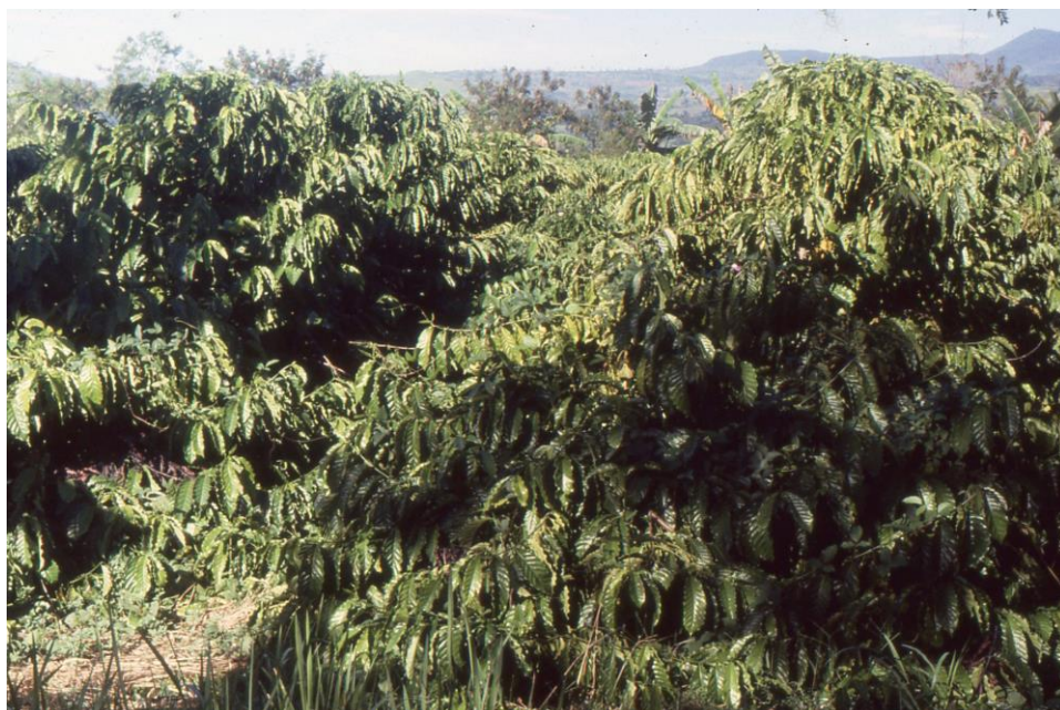
III Phil4 : Nord-Mindanao. 09 : San Miguel (1987). Plantation Imbayo avec les rangées de caféiers Arabica en floraisons non synchrones, entre Balaybalay à l'est et le flanc ouest du mont Katanglad (2880 m.).