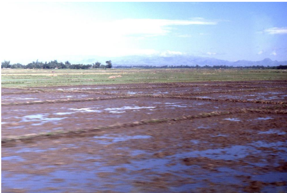
III Phil4 : Nord-Mindanao. 03 : Vers le sud, sur la Sayre HighWay entre Cagayan de Oro et Sumilao (1987). Rizières en attente.