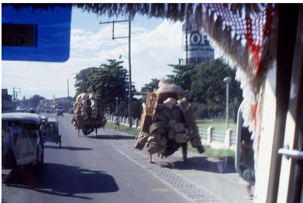
III Phi4 : Nord-Mindanao. 15 : Cagayan de Oro, province du Mirasmis Oriental (1987). Banlieue de la ville un jour de marché et son cortège de charrettes couvertes de vanneries souvent tractées à bras d'homme.