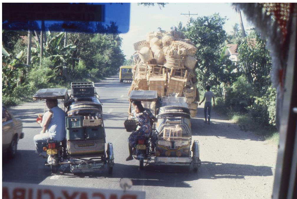
III Phi4 : Nord-Mindanao. 14 : Cagayan de Oro, province du Mirasmis Oriental (1987). A l'approche de la ville un jour de marché. Tout ce qui roule transporte des marchandises, surtout de la vannerie. La circulation se fait à droite en prenant des risques pour doubler dès que cela semble possible.