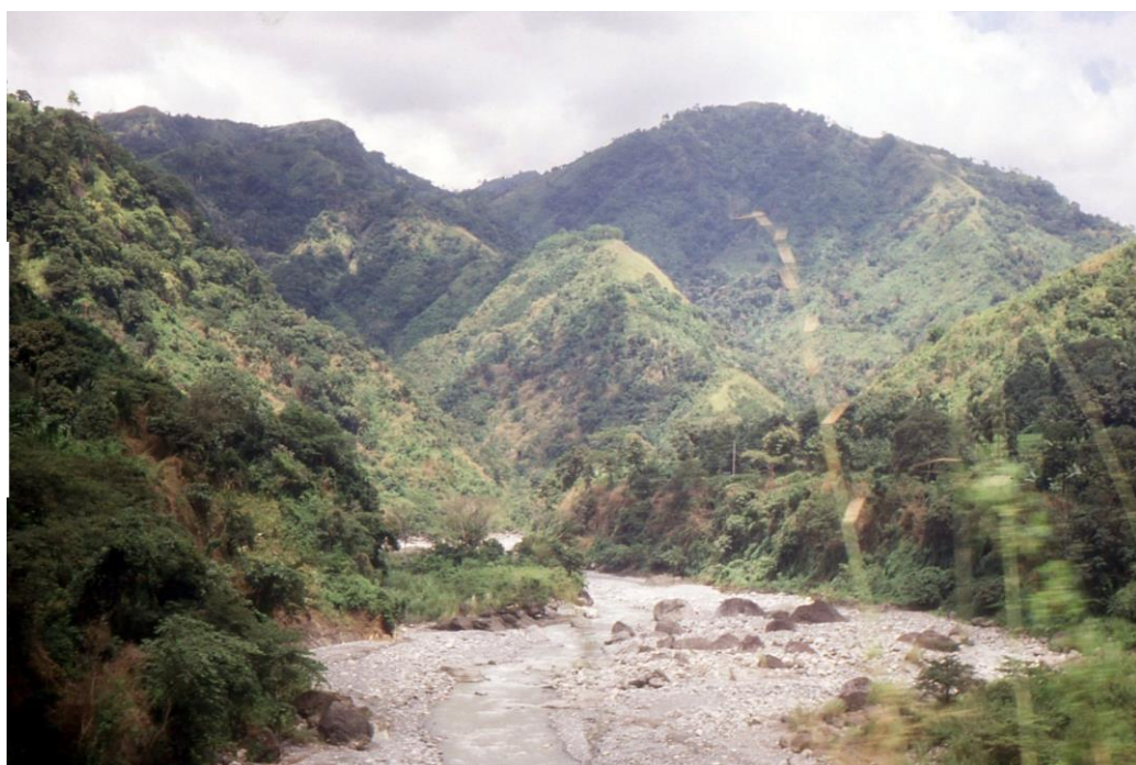
III Phil4 : Nord-Mindanao. 07 : Avant d'atteindre Malaybalay City, capitale de la province Bukidnon (1987), les massifs montagneux unissant les monts Kitanglad (2900 m) et Katanglad (2880 m).