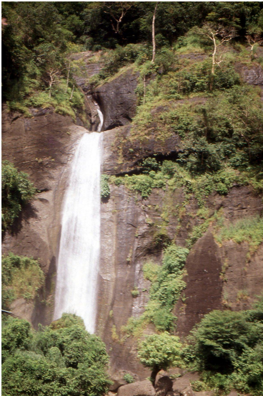
III Phil4 : Nord-Mindanao. 06 : Les chutes d'eau Alum Falls entre les villes de Sumilao et de Malaybalay (1987).