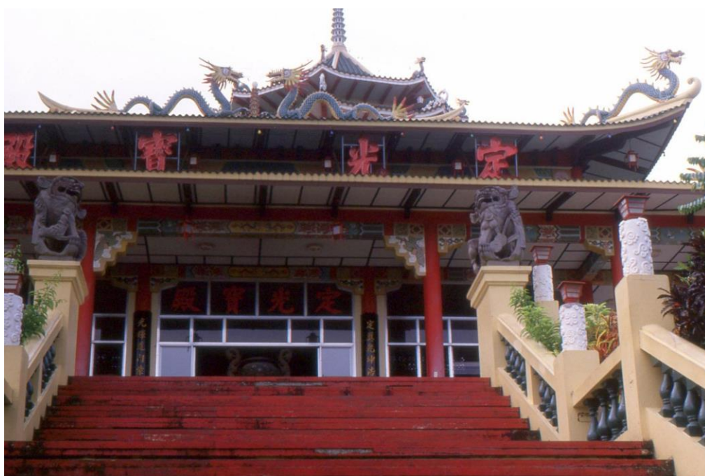
III Phil3 : Visayas-Cebu. 13 : Visayas Central Province (1987). Le temple taoïste (doctrine tao , « la voie », tant philosophique que religieuse), apparaît comme une curiosité touristique dans cette région à plus de 80 % catholique.