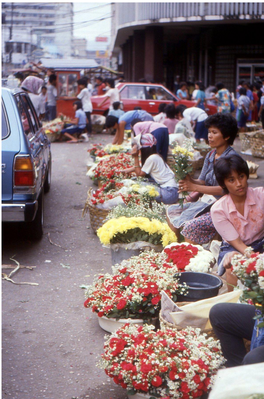
III Phil3 : Visayas-Cebu. 10 : Centre-ville (1987). Le marché aux fleurs, véritable carte postale vivante et colorée.