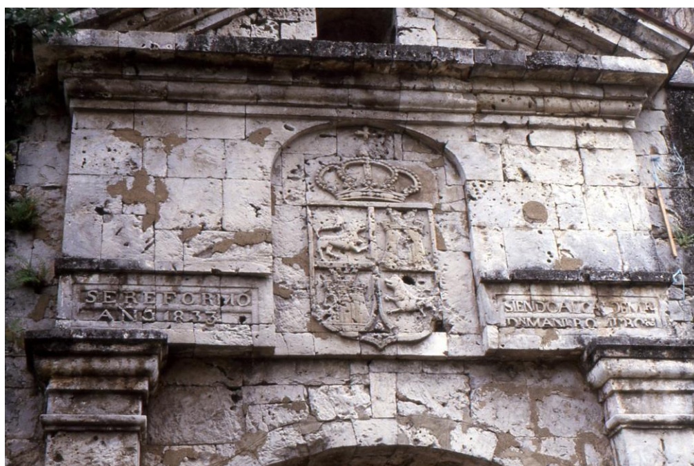
III Phil3 : Visayas-Cebu. 07 : Centre-ville (1987). Musée Casa Gorordo, datant de 1833 et l'un de ses linteaux sculptés à chapiteau triangulaire destiné à renforcer une voûte lobée.