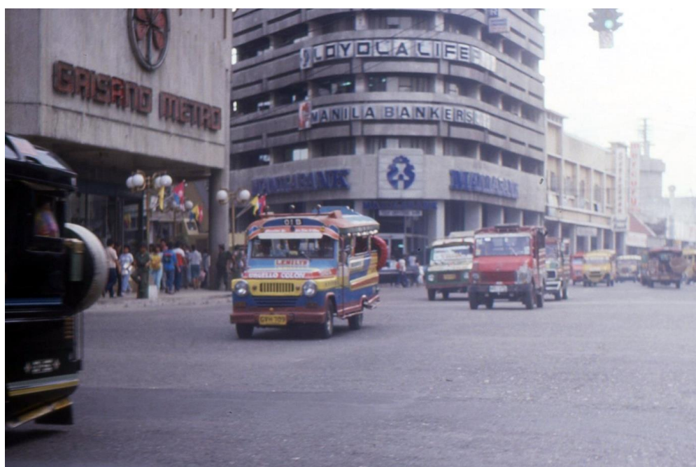
III Phil3 : Visayas-Cebu. 09 : Centre-ville (1987). Les jeepneys, moyens de transport public de la ville. Sur la gauche, l'hypermarché Brisano Metro, (le terme « metro » étant utilisé dans le sens de municipalité et non de nom de station ayant de quelconques transports sur rails).