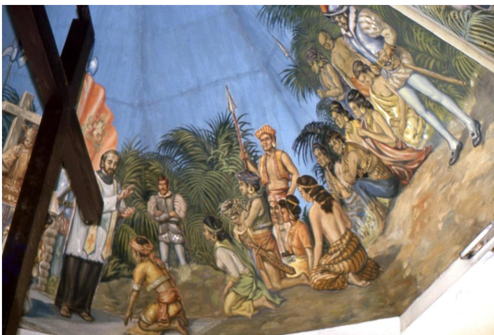
III Phil3 : Visayas-Cebu. 04 : Centre-ville, la « Croix de Magellan » (1987). Une seconde peinture au plafond complète la précédente et souligne le souci d'établir le christianisme au plus vite à travers tout l'archipel.