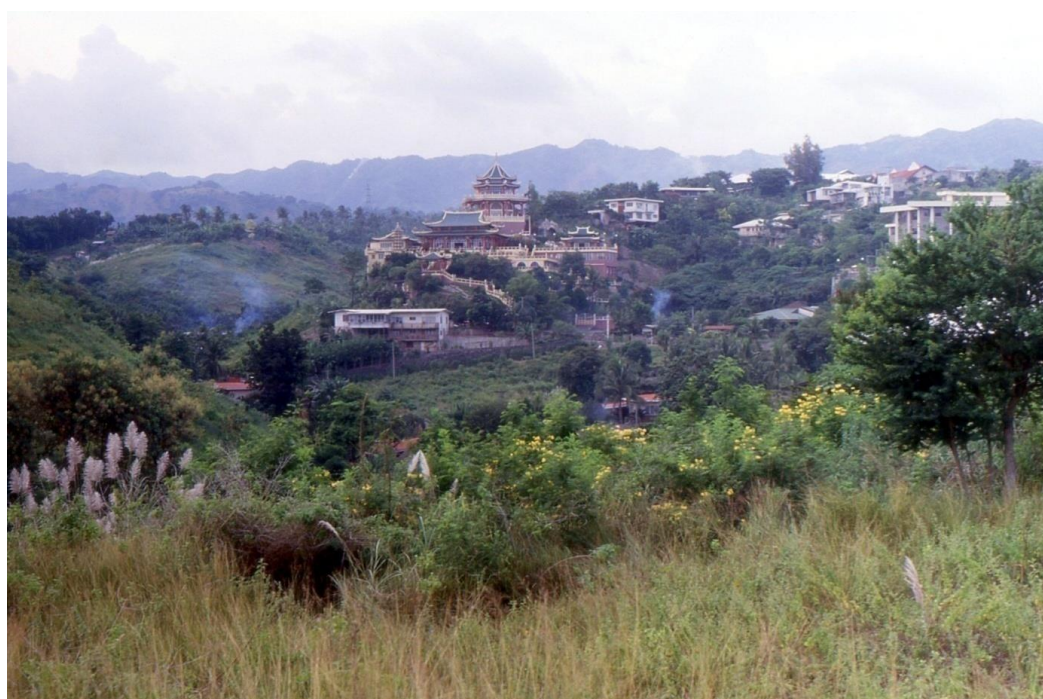
III Phil3 : Visayas-Cebu. 11 : Visayas Central Province (1987). Voisin de Cebu, un village dont le temple taoïste domine la capitale provinciale et ses deux villes voisines, Mandaue et Lapu-Lapu. A l'arrière-plan, la chaîne montagneuse Cabalasan (1108 m), épine dorsale qui souligne l'étréoussse et la forme allongée de l'île de Cebu (familièrement appelée Snack Island).