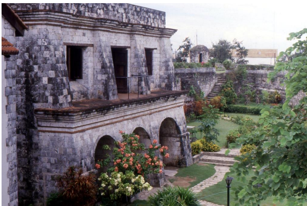
III Phil3 : Visayas-Cebu. 06 : Centre-ville (1987). L'intérieur du fort San Pedro est une construction coloniale espagnole représentative, loin du style philippin, massive et puissante pour résister aussi bien aux hommes qu'aux aléas naturels les plus violents tels les tremblements de terre.