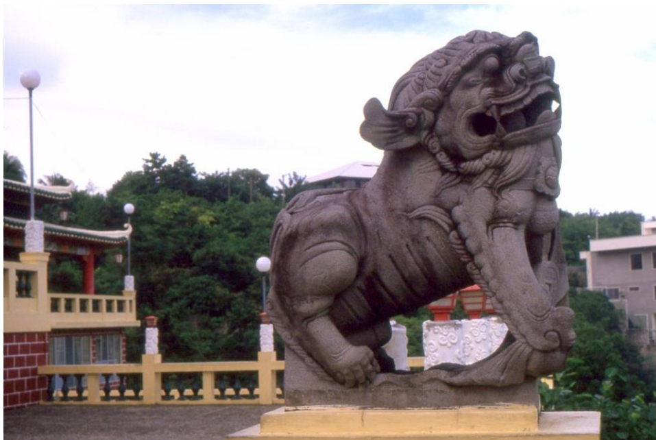
III Phil3 : Visayas-Cebu. 12 : Visayas Central Province (1987). Accompagnant le temple taoïste, ce symbole chinois atteste l'influence chinoise remontant au VI e siècle avant J-C.