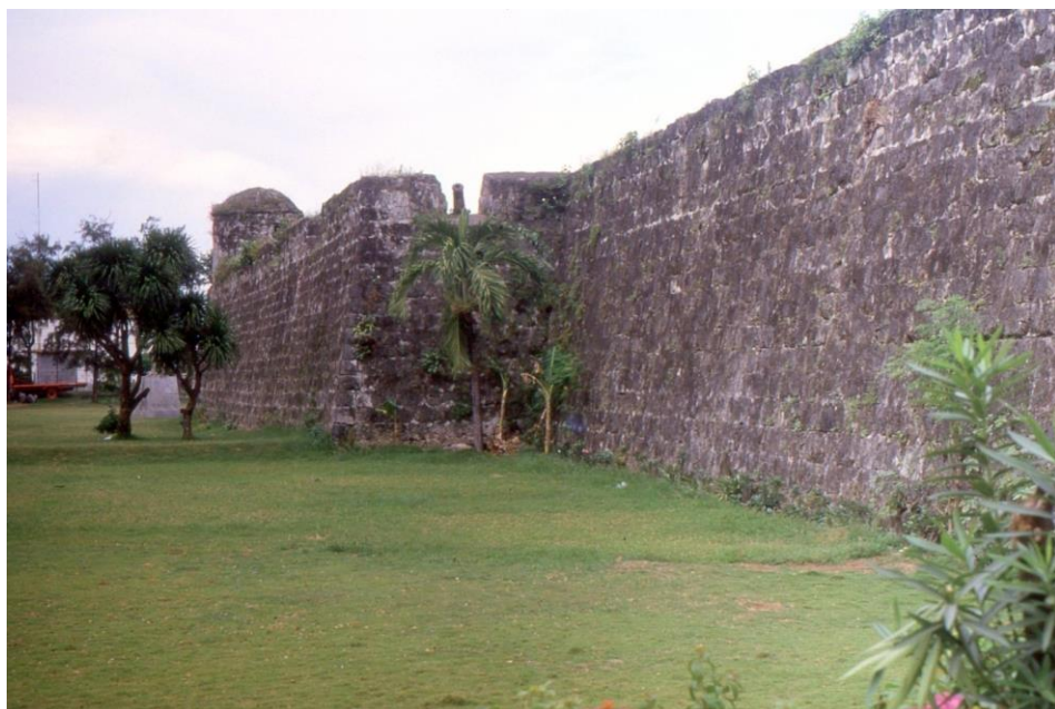
III Phil3 : Visayas-Cebu. 05 : Centre-ville (1987). Une partie des remparts du fort San Pedro.