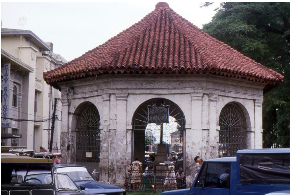
III Phil3 : Visayas-Cebu. 02 : Centre-ville, le Magellan's Cross (1987). C'est à la fois un sanctuaire et un mémorial commémorant l'arrivée des espagnols conduits par Magellan. Il abrite une croix de bois à l'image de celle qui fut érigée en signe de possession du pays au nom de l'Espagne catholique.