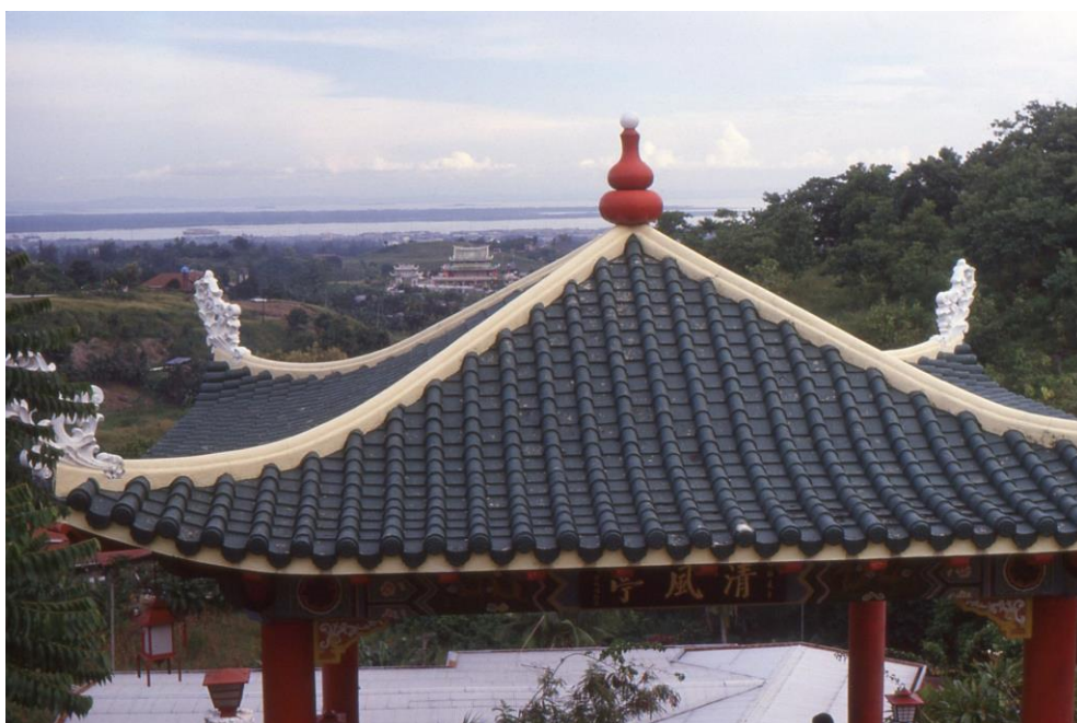
III Phil3 : Visayas-Cebu. 14 : Visayas Central Province (1987). A l'arrière-plan, le Mactan Chanel, séparant l'île de Cebu et l'île de Mactan (où Magellan trouva la mort le 21 avril 1521, une vingtaine de jours après avoir découvert l'archipel philippin et accosté à Cebu). Cette île abrite actuellement le Mactan Cebu International Airport, qui a un trafic intense en raison d'une position centrale pour ses connexions avec les pays bordant le Pacifique.