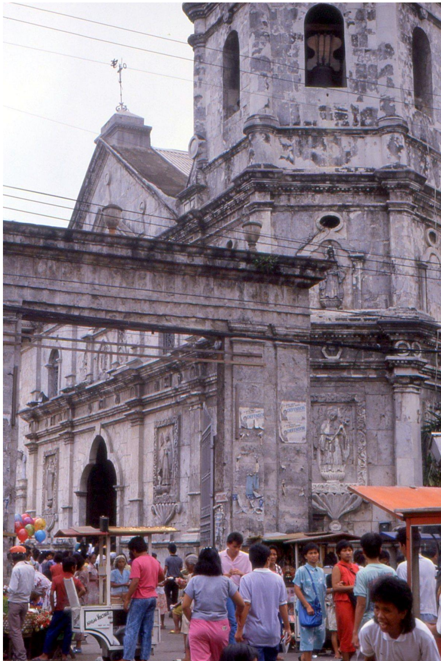
III Phil3 : Visayas-Cebu. 08 : Centre-ville (1987). Basilique de l'Enfant Saint (El Santo Niño), le saint patron de Cebu. L'édifice, grandiose, a une architecture européenne et une structure massive destinée à résister aux tremblements de terre. A remarquer, les niches sur les façades avec des effigies religieuses et la porte d'entrée trilobée.