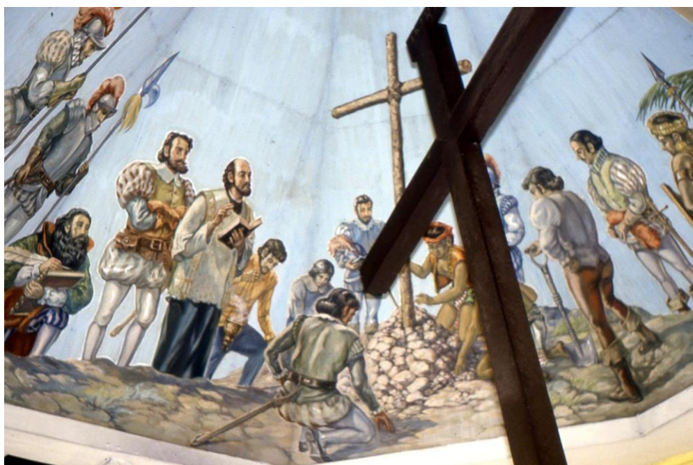
III Phil3 : Visayas-Cebu. 03 : Centre-ville, la « Croix de Magellan » (1987). A l'intérieur, on découvre effectivement, au centre, une croix de bois et au plafond, une première peinture représentant l'implantation d'une croix chrétienne telle qu'elle fut érigée à l'arrivée sur l'île.