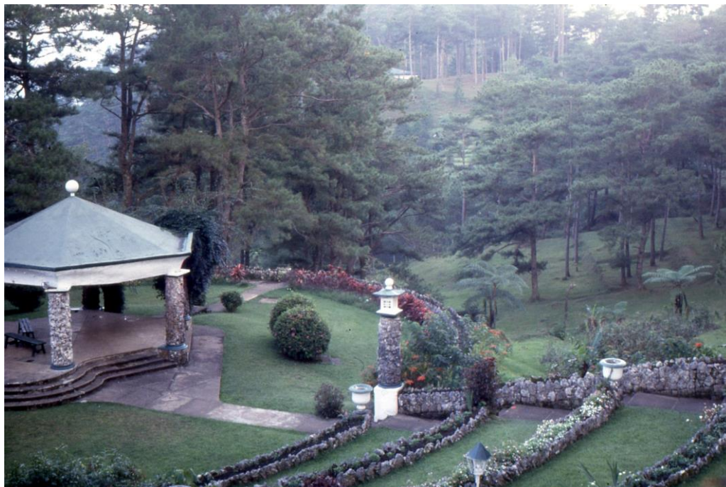
III Phil2 : Luzon-Baguio. 21 : Baguio (1987). The Bell Amphitheater, souvent utilisé par le public en garden wedding venue au sein du parc « R & R » (Rest and Relaxation) établi par l'armée américaine en 1903 (rétrocédé au gouvernement philippin en 1991).