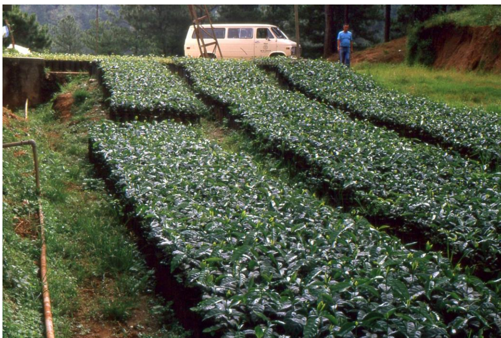
III Phil2 : Luzon-Baguio. 11 : Baguio (1987). Pépinière à ciel ouvert de caféiers Arabica au HARC (Highland Agricultural Research Center).