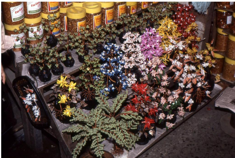
III Phil2 : Luzon-Baguio. 18 : Baguio, le marché Porta Vaga Mall (1987). Stand plantes artificielles et leurs accessoires.