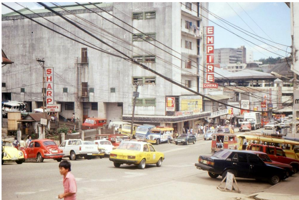
III Phil2 : Luzon-Baguio. 12 : Baguio (1987). Centre-ville de Baguio city et le cinéma Empire (voie descendante, Abanao Street ; voie montante, Harrison Road).