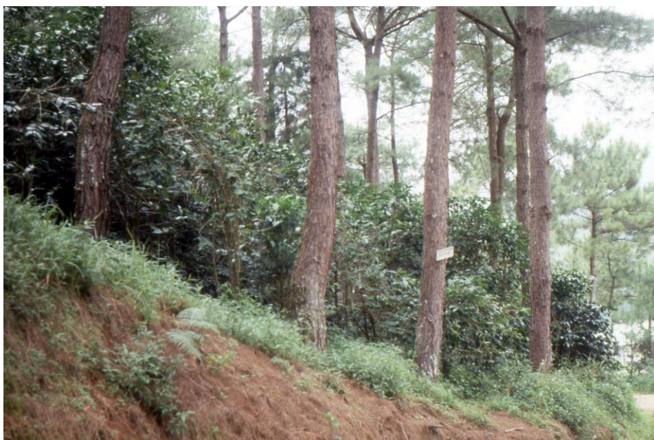
III Phil2 : Luzon-Baguio. 10 : Baguio (1987). Plantation de caféiers Arabica sous ombrage de pins au HARC (Highland Agricultural Research Center). Les aiguilles de pin sont parfois utilisées aux Philippines pour une décoration fine en vannerie.