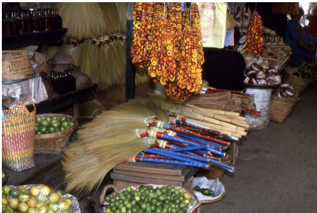
III Phil2 : Luzon-Baguio. 19 : Baguio, le marché Porta Vaga Mall (1987). Stand d'articles variés, chasses mouches à manche bleu, plateaux et corbeilles avec des fruits, paniers à torsades colorées, chapelets de mini-flotteurs tressés orange pour la pêche.