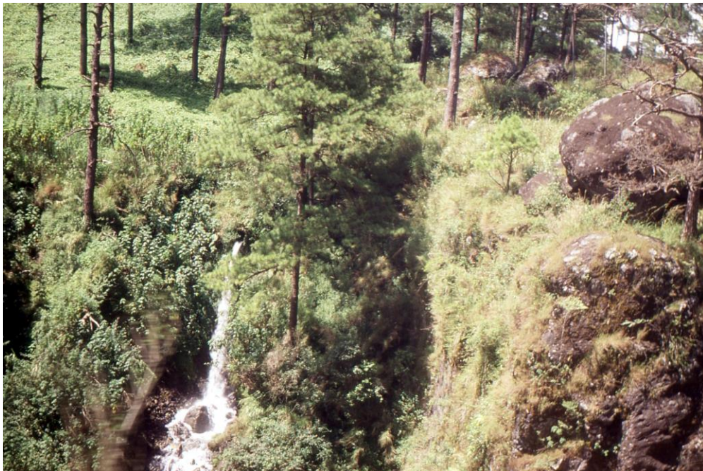
III Phil2 : Luzon-Baguio. 09 : Hydrographie importante tout autour de Baguio (1987).