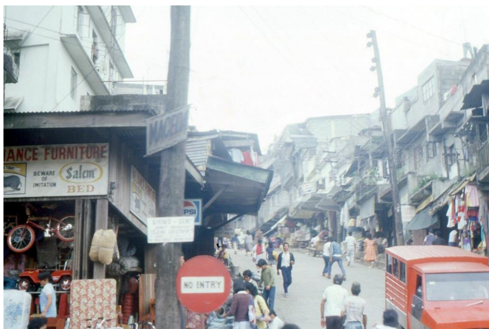
III Phil2 : Luzon-Baguio. 13 : Baguio (1987). Une rue commerçante en bordure du Quirino Hill (panneau de sens interdit avec la mention explicative « NO ENTRY »).