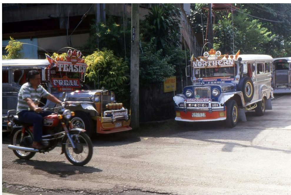
III Phil2 : Luzon-Baguio. 14 : Baguio (1987). Une des nombreuses stations de bus, le Dangwa Terminal sur la Magsaysay Avenue, avec les jeepneys, moyens de transport public de la ville des plus originaux.