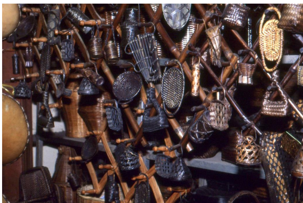
III Phil2 : Luzon-Baguio. 20 : Baguio, le marché Porta Vaga Mall (1987). Panoplie d'objets traditionnels miniaturisés en vanneries (soit en rotin, en osier ou en fibres de bambou).