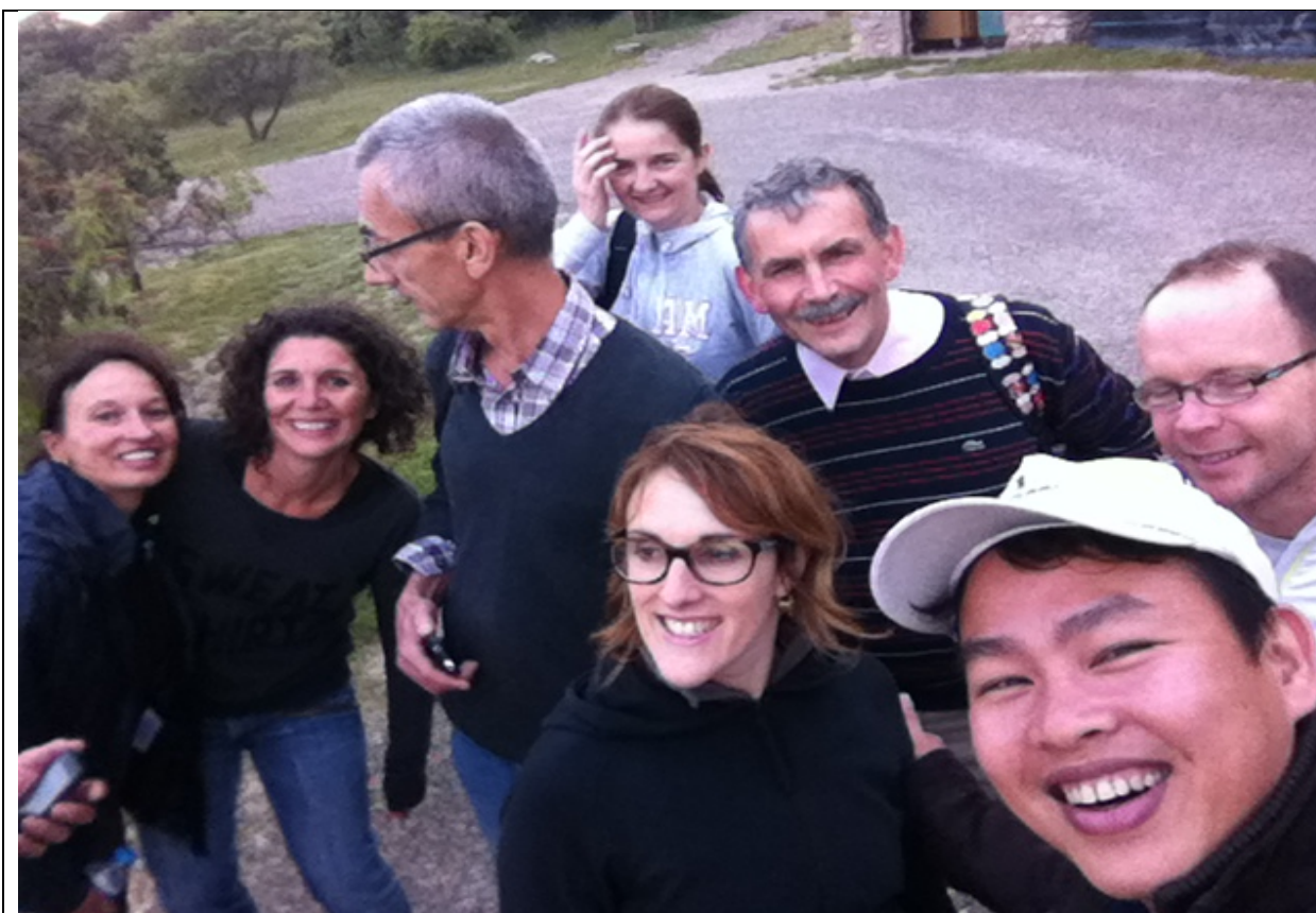
Les membres du CIRAD en randonnée au Pic Saint-Loup – 2016.