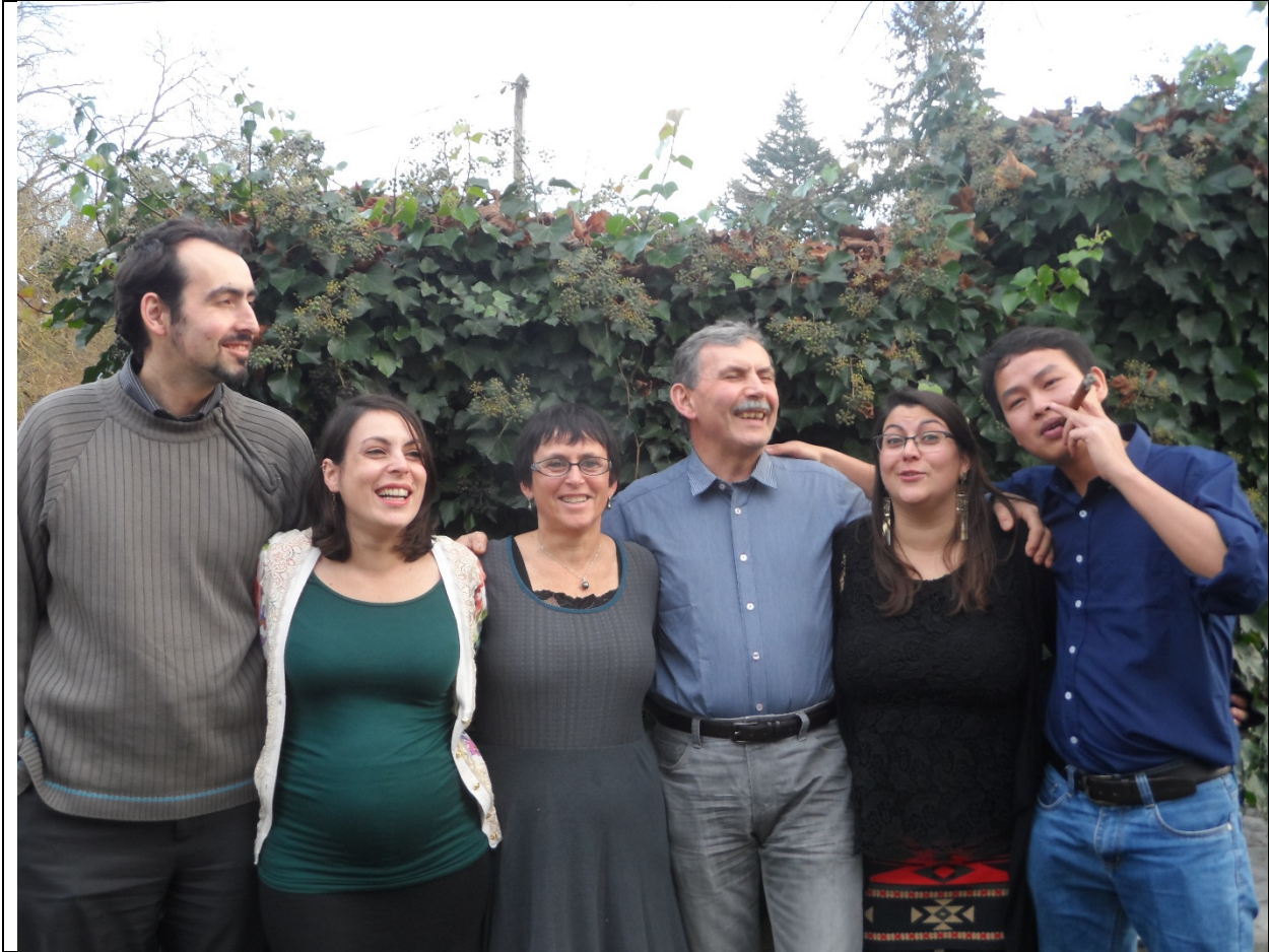
Les membres de la famille réunis pour Noël à Vendôme, France – 2015.